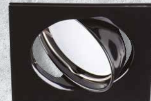
23853 TRIBIS II L B