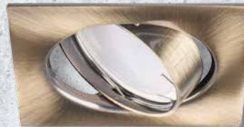
23843 TRIBIS II L AB

décliné en cinq coloris: chrome, chrome mat, laiton patiné, noir et blanc.