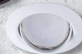
23854 TRIBIS II O W