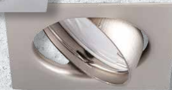
23845 TRIBIS II L C/M