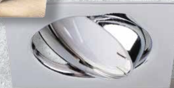
23844 TRIBIS II L C