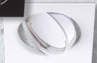
23849 TRIBIS II L W